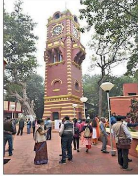
চলছে হেরিটেজ ওয়াক

সোনি রামাধিন, রোহন কানহাই, অলভিন কালীচরণ থেকে শিবনারায়ণ চন্দ্রপাল, রামনরেশ সারওয়ান। ওয়েস্ট ইন্ডিজের ক্রিকেট দলে বার বার দেখা